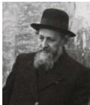
The Brisker Rav