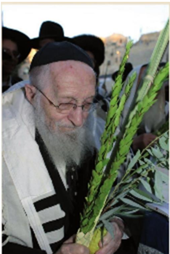
R' Chaim Pinchos Scheinberg at the Kosel on Sukkos

וּלְקַחְתֶּם לָכֶם בַּיּוֹם הָרִאשׁוֹן פְּרֵי עֵץ הָדָר BITACHON WEEKLY הָאֲזִינוּ – סוֹכּוֹת תשפ"ג