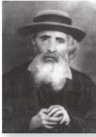
R' Yehoshua Leib Diskin

Yehoshua Leib Diskin what to do, and he advised that when Chazal say: כָּל הַמְּקַיִם אֶת הַתּוֹרָה מְעוֹנֵי סוּפוֹ לְקַיְמָה A poor person who learns Torah will eventually become rich, also refers to one who is "poor" in Kish'ron intelligence. The family followed his advice, and sure enough their son-in-law eventually developed new Kishronos ["wealth"] and became a big Talmid Chacham .