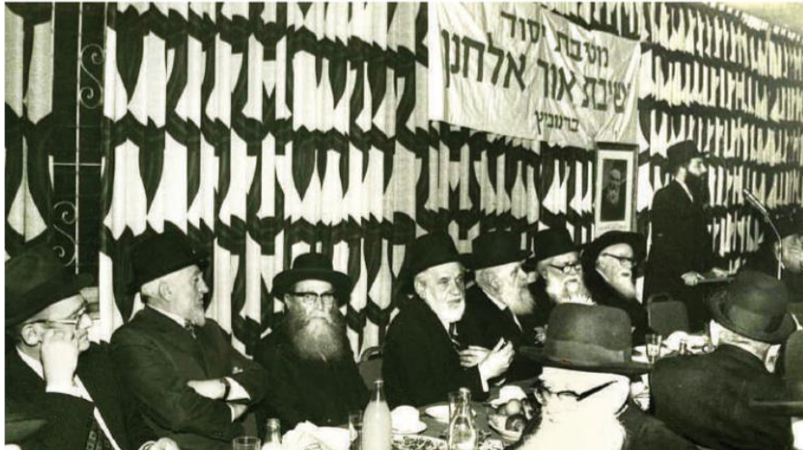
At the groundbreaking of Yeshivas Ohr Elchonon