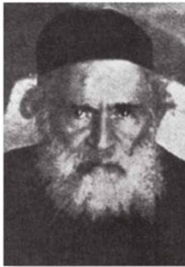
רבי נפתלי אמסטרדם