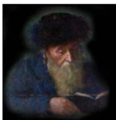
R' Chaim of Sanz