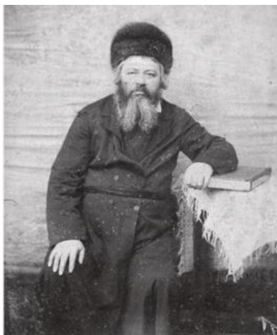
R' Yechiel Michel Epstein, author of Aruch HaShulchan, the Rov of Novardok