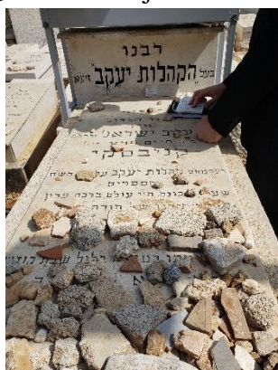
Keiver of the Steipler Gaon, R' Yaakov Yisroel Kanievsky